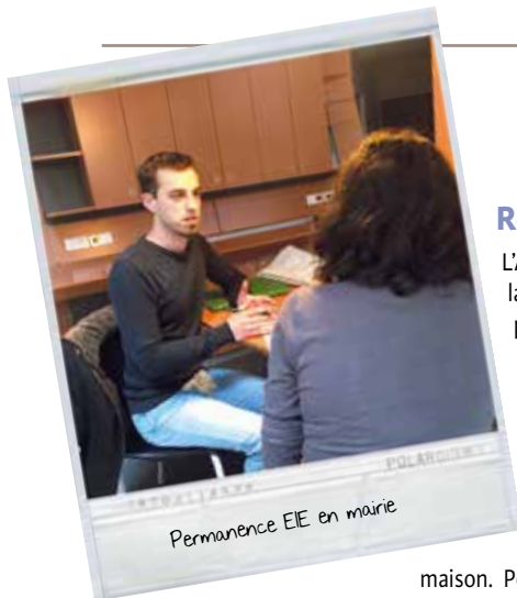
Permanence EE en mairie

Quatre écoles et une crèche pessacaises sont dotées de toits végétalisés, pour une surface totale de 4 550 m 2 . Pour un coût à peu près identique à une toiture classique, les toits végétalisés permettent de réguler la mise en réseau des eaux de pluies grâce à leur substrat de terre qui en éponge une partie. Ils servent par ailleurs d'isolant, limitant les chocs thermiques en cas de fortes chaleurs notamment : la terre fait tampon, fournissant de l'inertie au bâtiment et permettant aux toitures de vieillir moins vite. Pour limiter les frais d'entretien, la Ville a opté pour des toits de type « Tundra » formant un tapis végétal ras à dominante de sedum et de mousses, dont l'aspect évolue au fil des saisons, passant du vert printanier au rouge en période de sécheresse. La crèche Cazalouette, les écoles Bellegrave, Dorgelès, Montesquieu et Aristide Briand en sont dotées.