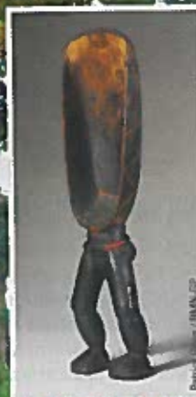
Chris des Glaces / Photo-vestige