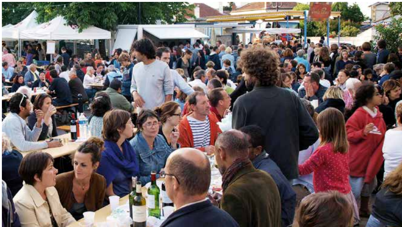
À Saint-Augustin, les fêtes s'organisent tout au long de l'année.

Quelle est la meilleure saison pour organiser une fête en plein air ? Comme pour les goûts et les couleurs ou les quatre concertos de Vivaldi, chacun a ses préférences. Il y a les adeptes des marrons chauds dégustés dans la rue, bien emmitouflés, en attendant l'arrivée du Père Noël, ceux pour qui la fête s'organise au soleil couchant en tong et bermuda, un (petit) verre bien frais à la main, et ceux, enfin, qui voient dans le printemps, le moment idéal de festoyer pour oublier les frimas de l'hiver.