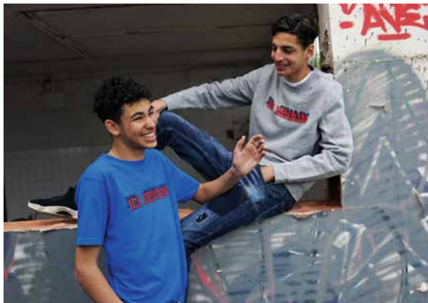
Une ligne « made in Bastide » aux couleurs d'Ici Demain en vente cet été.