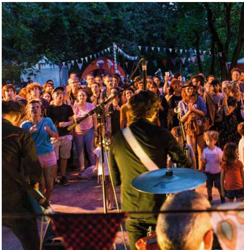
Green Intermezzo et l'Arty Garden Party : l'union fait la fête.

Programme complet sur bordeaux.fr , sur la page Facebook Quartier Nansouty Saint-Genès et Merci Gertrude