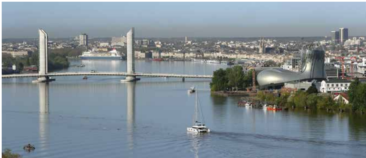
Bordeaux Maritime fête le fleuve pour promouvoir ses spécificités.

L e plus maritime des quartiers de Bordeaux se situe au nord de la ville, ce qui le rend, géographiquement, le plus proche de l'estuaire de la Gironde. On lui a d'ailleurs donné le nom de Bordeaux... Maritime.