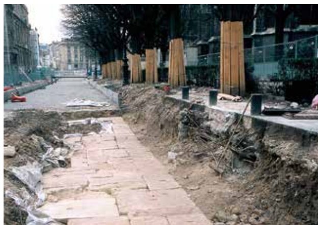
L'arase du rempart antique sous les quais du tram A place Pey-Berland.

L'importance des vestiges matériels dans la compréhension de l'évolution de Bordeaux est apparue en particulier ces vingt dernières années, en relation avec la recherche historique et le développement de l'archéologie préventive. Celle-ci trouve un large champ d'application dans les grands travaux d'aménagement de la ville au début du XXI e siècle, notamment le tramway. Grâce aux fouilles, le passé de la ville se dessine peu à peu. Bordeaux a, par exemple, vieilli de trois siècles, passant d'une origine supposée au III e siècle avant notre ère à l'existence démontrée d'une première agglomération dès le VI e siècle avant J.-C. On a réinterprété l'évolution des cours d'eau, redessiné la ville antique et médiévale, (re)découvert des monuments. Par exemple, les fouilles des parkings place de la Bourse ont mis au jour l'embouchure du port intérieur romain et, le long des quais, dévoilé l'évolution de la berge et la vie du port jusqu'au XIX e siècle. Et les fouilles sur la place Pey-Berland ont révélé des trésors... Depuis 2004, une zone de sensibilité archéologique s'étendant au-delà du centre historique permet une meilleure prise en compte de l'archéologie. Dans ce périmètre, les autorisations d'urbanisme sont soumises au Service régional de l'archéologie (Drac), qui prescrit alors un diagnostic qui entraîne ou non des fouilles préventives avant aménagement.